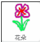
◆ 複製 15 朵花 ( 程式努力理解一下哦！後面課程有詳細解說 )